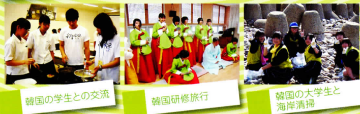
韓国の学生との交流