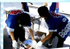
対高マーケット (販売実習)