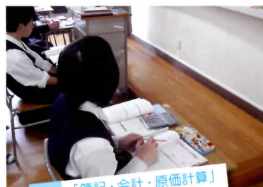
「簿記・会計・原価計算」では、電卓を使います。