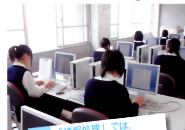
「情報処理」では、パソコンを使います。