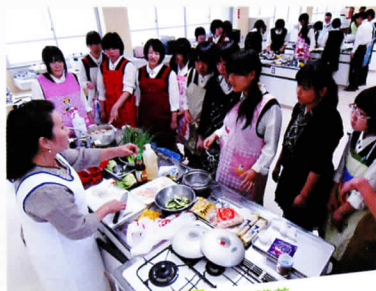
出張講義 (韓国料理)