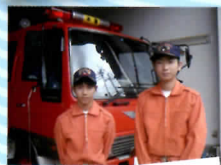
インターンシップ (職場体験)